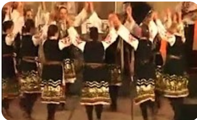
Фиг. 1. Фрагмент от танца „Момински празник в Шоплука“, част 1.

„Момински празник в Шоплука“: Част Първа. Девойки на групи, с китки, се появяват на сцената; всяка група има своя специфична игра и рисунок. Темпото нараства в очакване на „Василията“ .