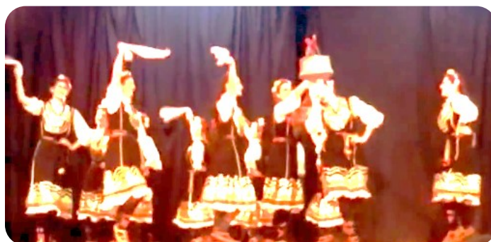
Фиг. 3. Фрагмент от танца „Момински празник в Шоплука“, част 3.

„Момински празник в Шоплука“: Част Трета. Започва устремно, със сложни танцови движения и комбинации. Много бравурен, ефектен танц със сложна композиция и хореографски текст, както и използван реквизит.