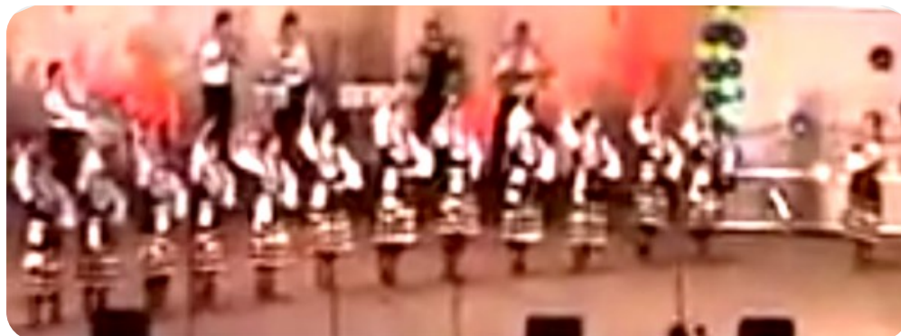
Фиг. 2. Фрагмент от танца „Момински празник в Шоплука“, част 2.

„Момински празник в Шоплука“: Част Трета. Започва устремно, със сложни танцови движения и комбинации. Много бравурен, ефектен танц със сложна композиция и хореографски текст, както и използван реквизит.